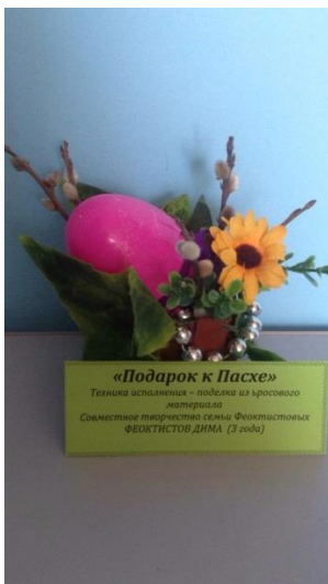
«Подарок к Пасхе» Техника исполнения – поделка из бросового материала Совместное творчество семьи Феоктистовых ФЕОКТИСТОВ ДИМА (3 года)