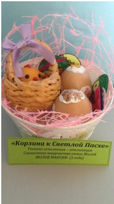
«Корзина к Светлой Пасхе» Техника исполнения – аппликация Совместное творчество семьи Жолоб ЖОЛОБ МАКСИМ (3 года)